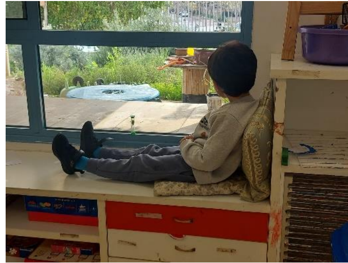
איור 10 מרחב ההתבוננות- החוצה או פנימה