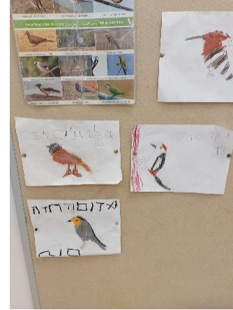
איור 6 לוח תוכן ומרכז החקר