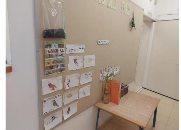
איור 5 לוח תוכן ומרכז החקר