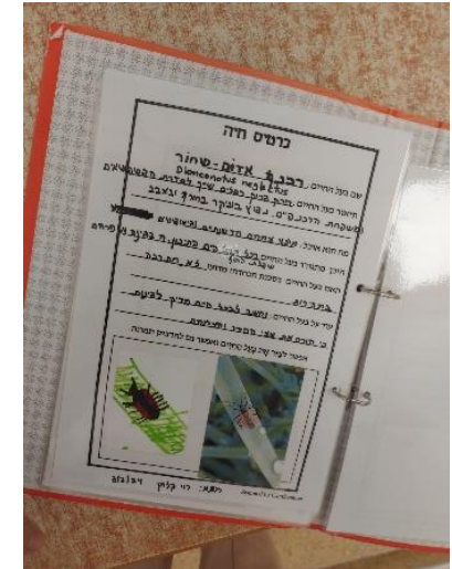
איור 9 קלסר מגדיר בעלי חיים של גן דולב